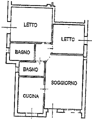
PIANTA PIANO TERRA h 2,70

Catasto dei Fabbricati - Situazione al 11/04/2024 - Comune di CERVIA (C553) - < Foglio 59 - Particella 1220 - Subalterno 5 > Pianta 01 VIA DEI COSMONAUTI Piano T